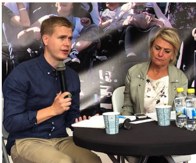
Miljöpartiets språkrör Gustav Fridolin och Eva Hamilton.

Miljöpartiets språkrör Gustav Fridolin var den enda, från övriga partier deltog andra ledande partiföreträdare. Liksom tidigare år i Almedalen medverkade vår ordförande och andra företrädare i olika arrangemang och paneler som anordnades under veckan.