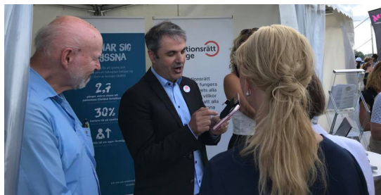
Samordningsminister Ibrahim Baylan på besök i tältet.

I år valde vi att medverka vid Järvaveckan som anordnades för andra året i rad.